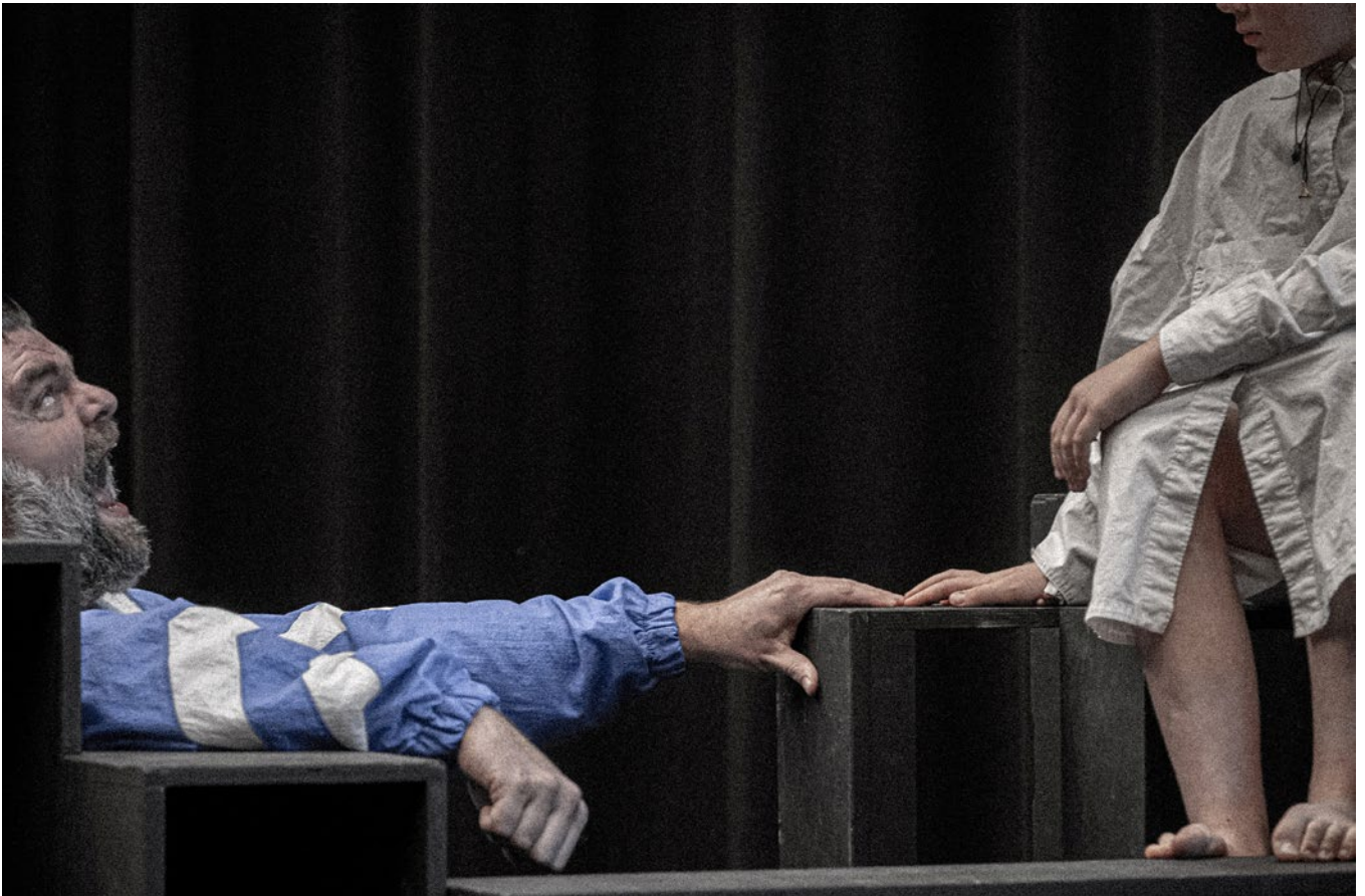
Pépé Chat, répétitions décembre 2022