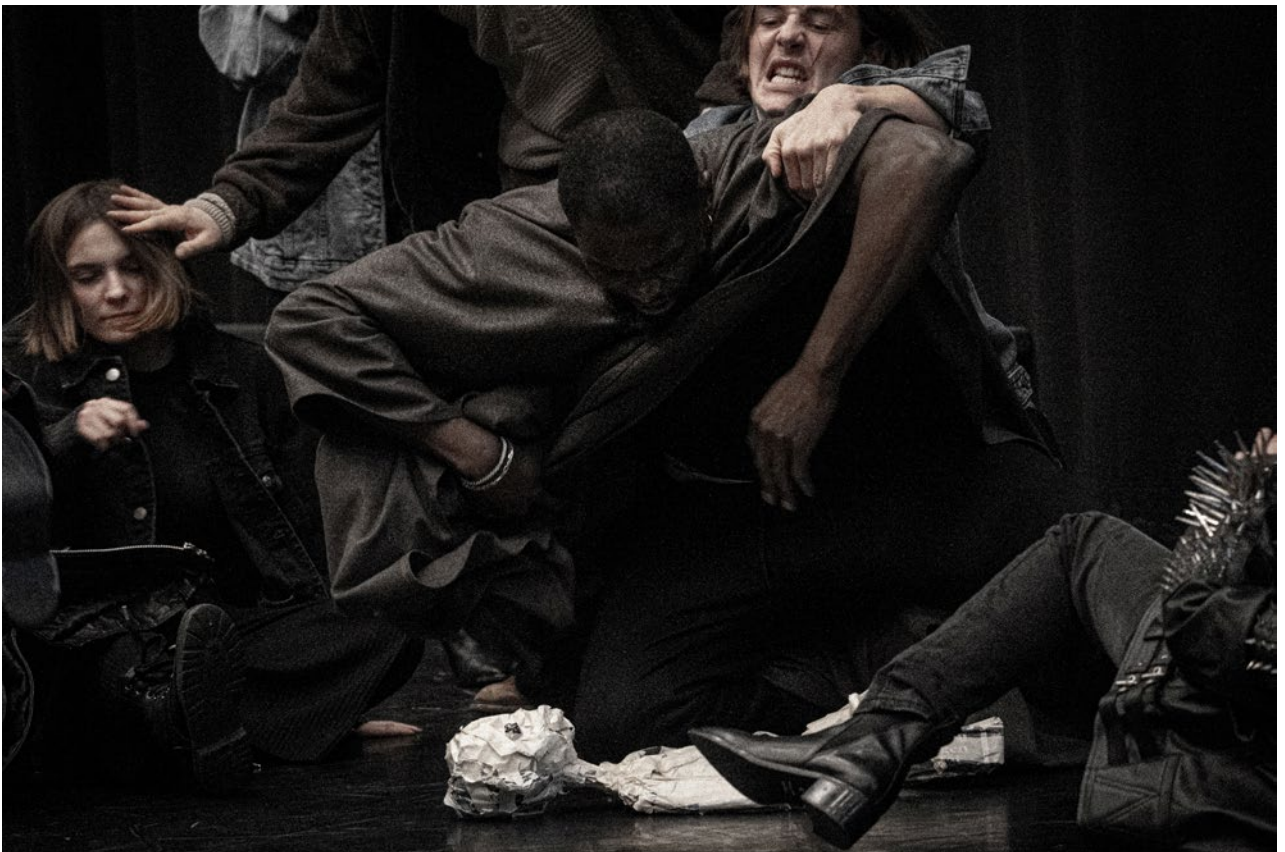
Pépé Chat, répétitions décembre 2022