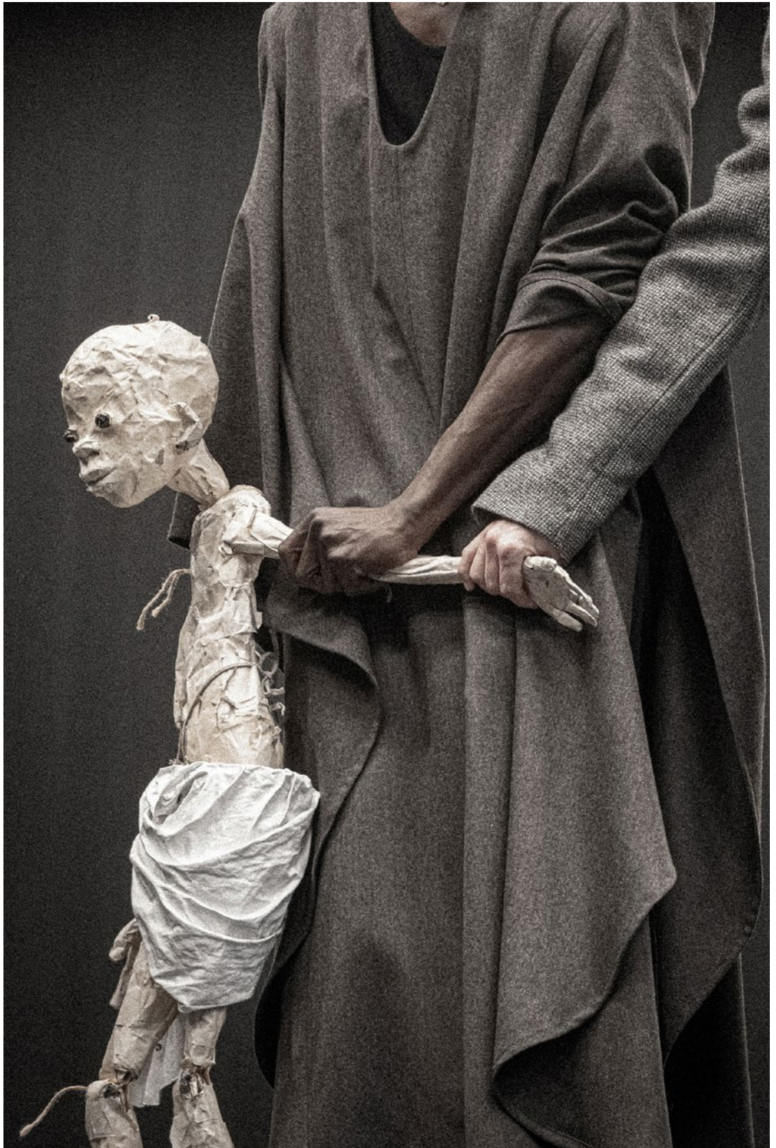
Pépé Chat, répétitions décembre 2022