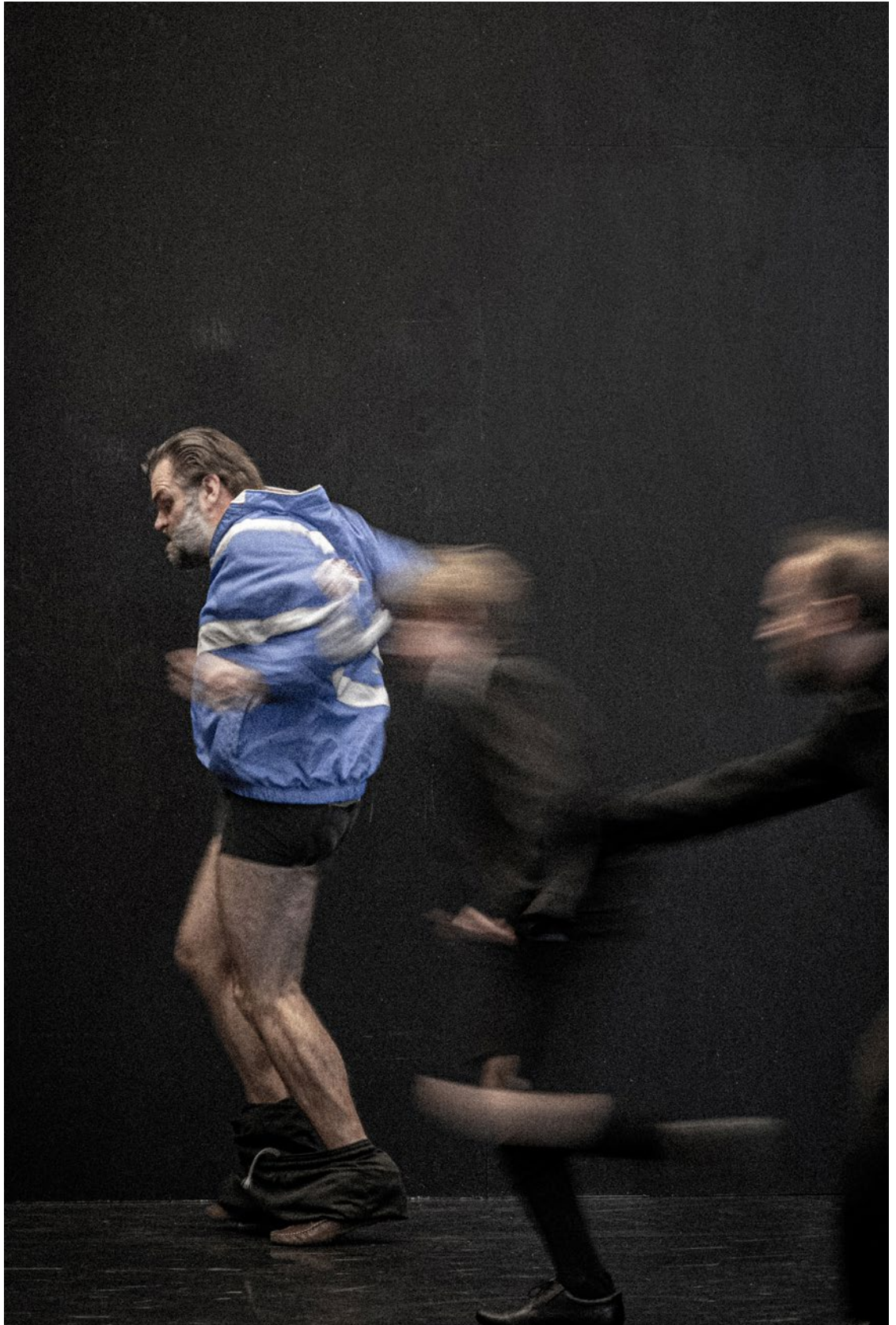
Pépe Chat, répétitions décembre 2022